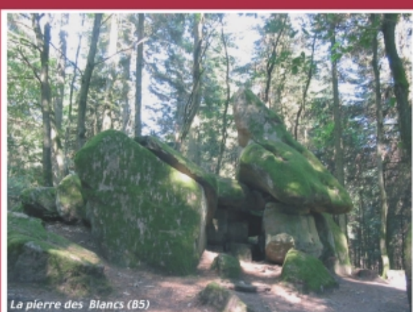
La pierre des Blancs (B5)

en mémoire des résistants du maquis de Beaubery et du bataillon du Charolais. Une esplanade offre une superbe vue panoramique. Bienvenue pour la découverte de Beaubery.